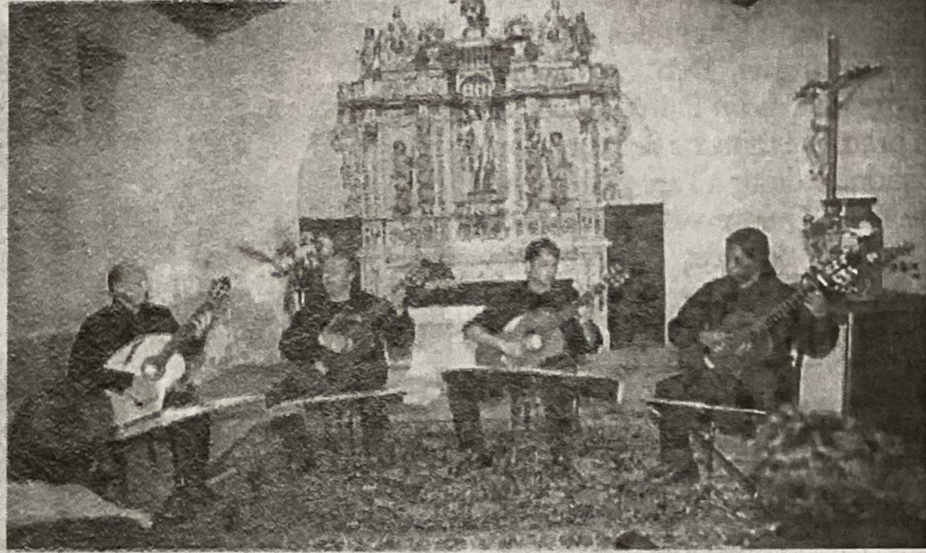
Le quatuor devant le retable dédié à Saint Sébastien.

Le quatuor de guitare "Méditerranée" donnera dimanche un concert à la chapelle Saint Sébastien.