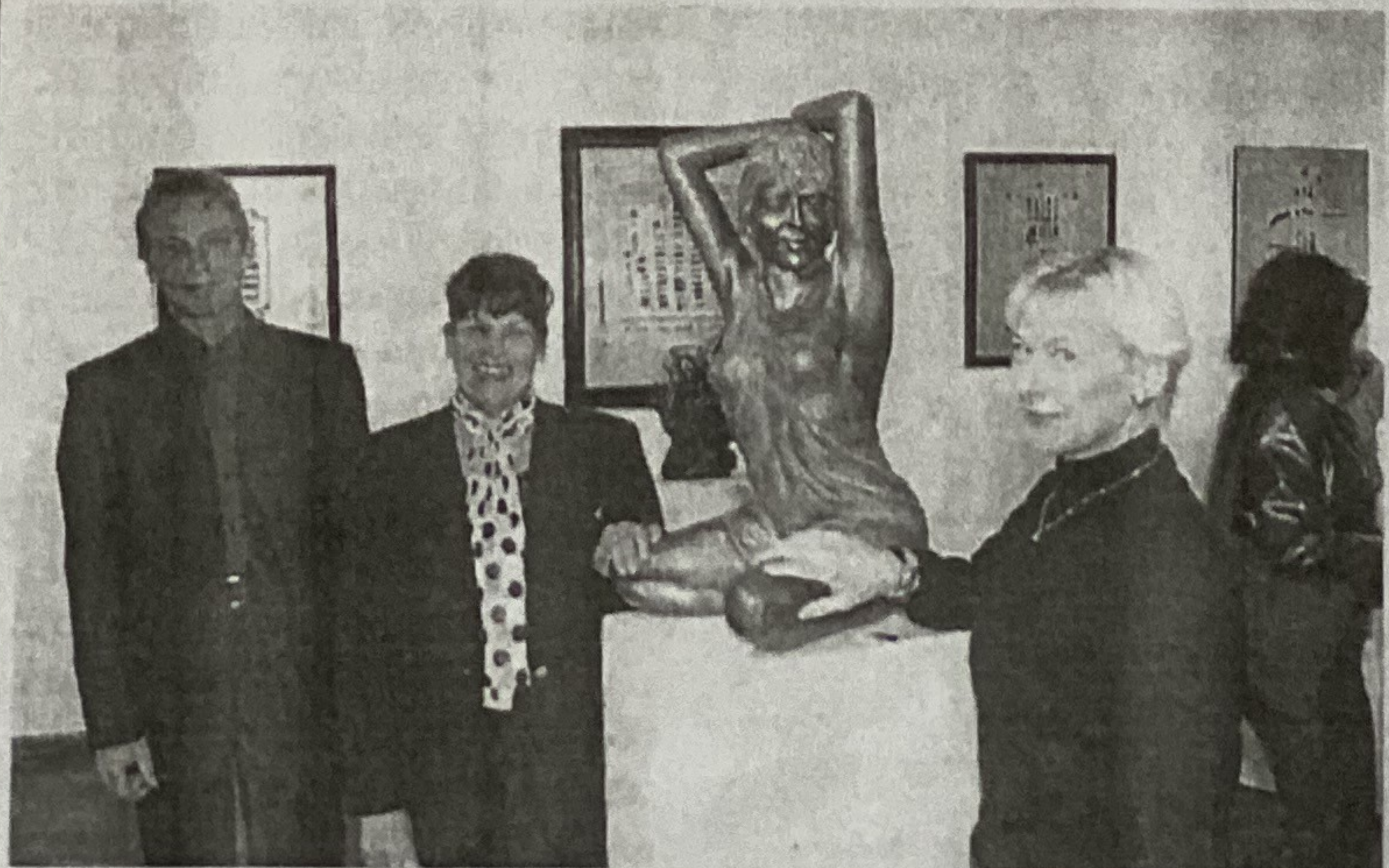
Lors du vernissage, les trois artistes devant une sculpture de Josepha Pallas.