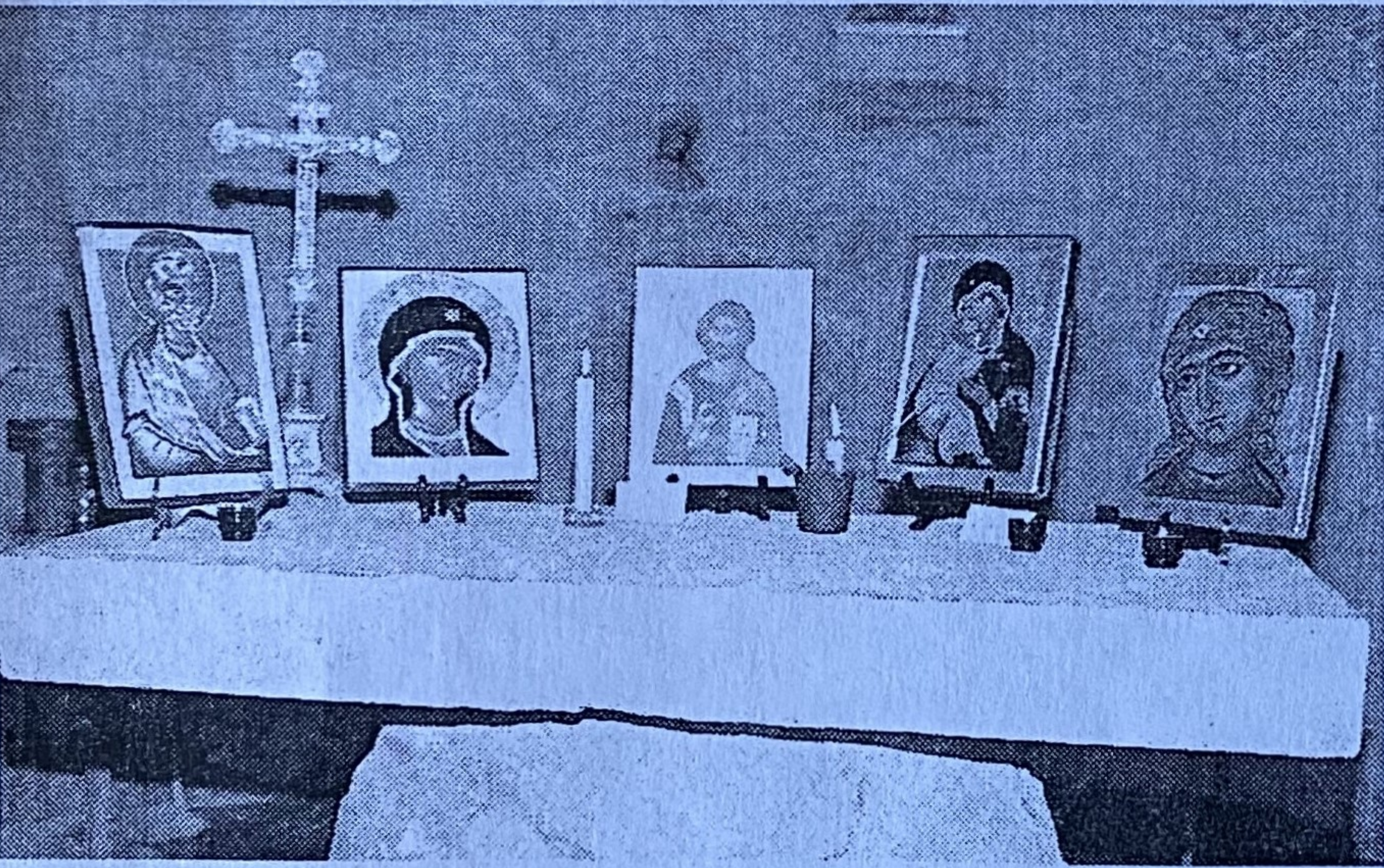
Dans l'église, les icônes sont mises en valeur sur l'autel.