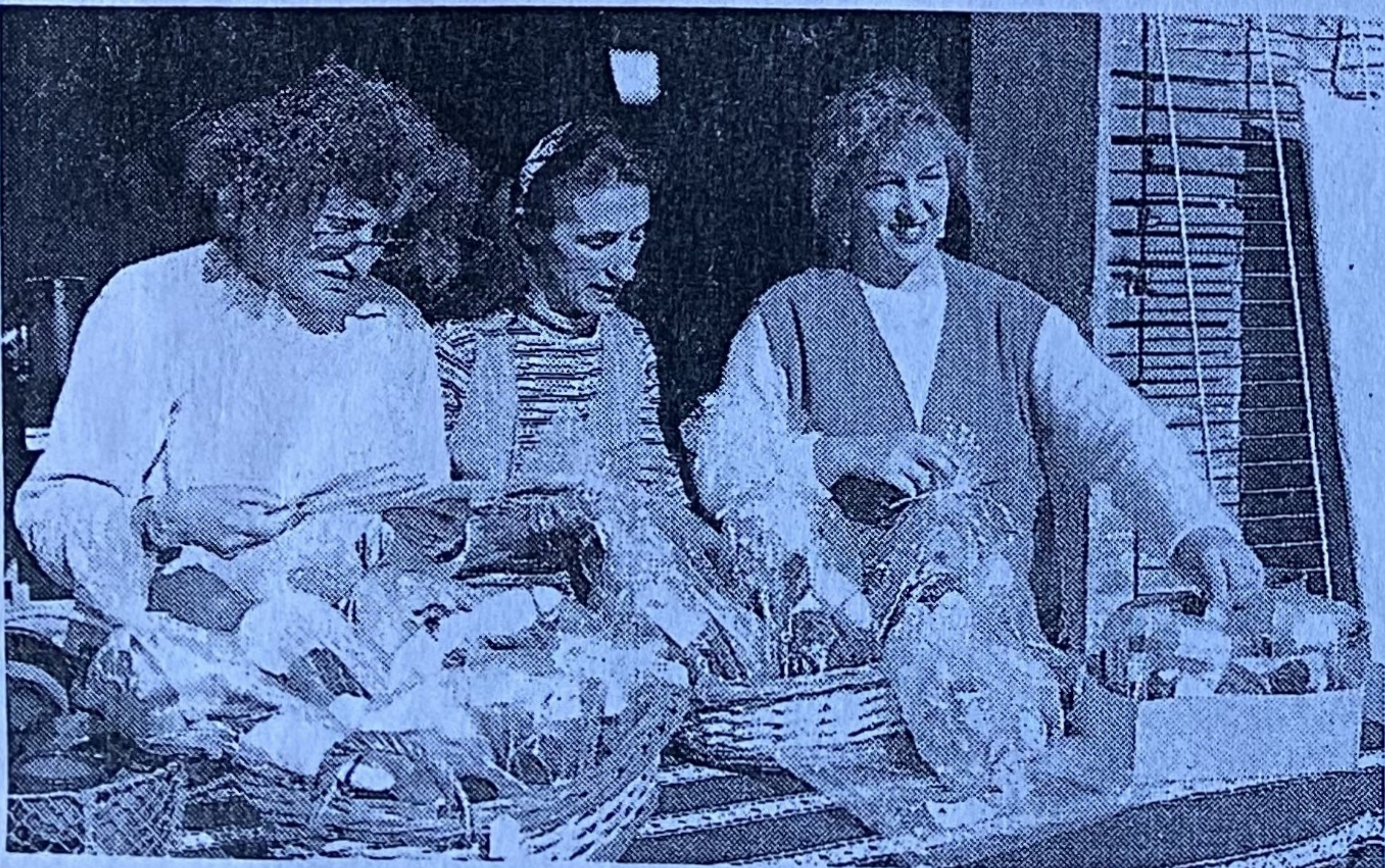
A "l'Hostal Catala", des produits du terroir ...