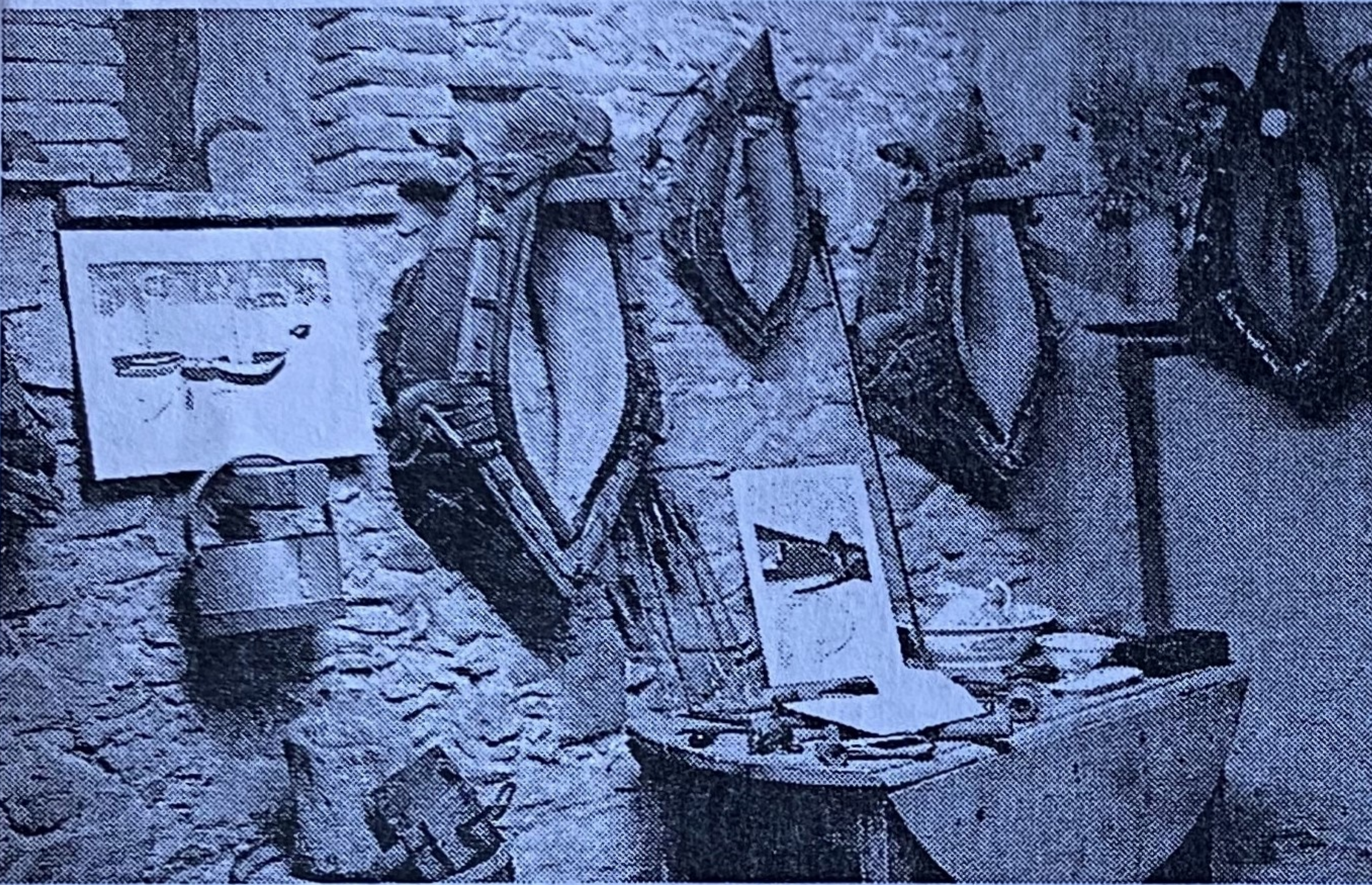
Parmi de vieux outils, quelques tableaux colorés.